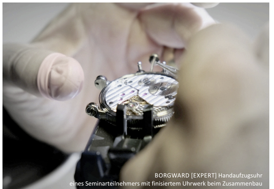
BORGWARD [EXPERT] Handaufzugsuhr eines Seminarteilnehmers mit finisiertem Uhrwerk beim Zusammenbau